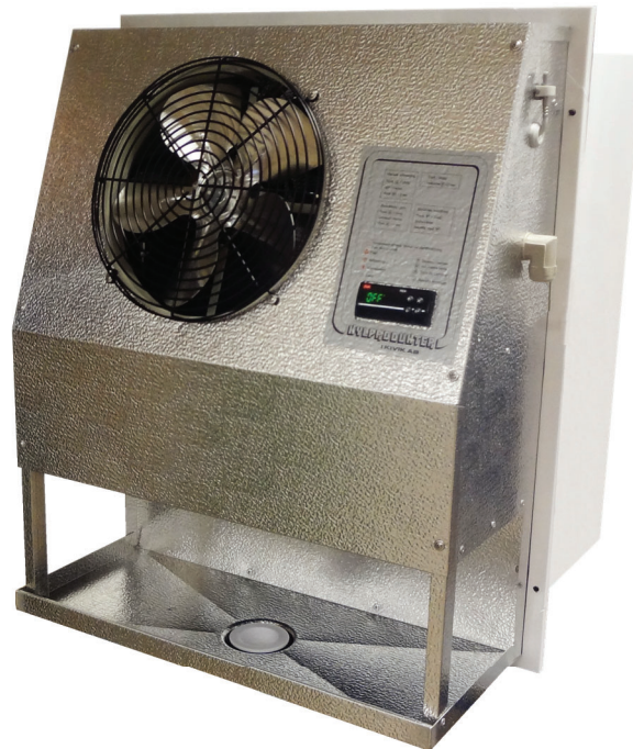
Från kalla sidan