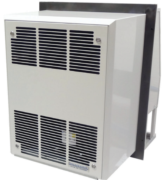
Från varma sidan