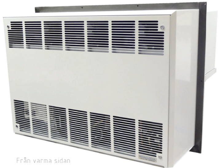
Från varma sidan