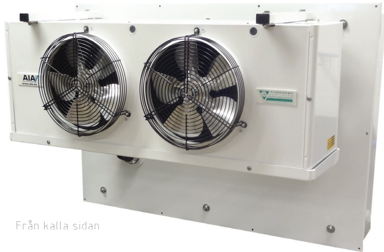
Från kalla sidan