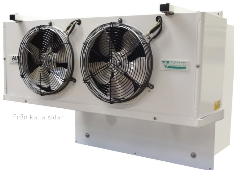
Från kalla sidan