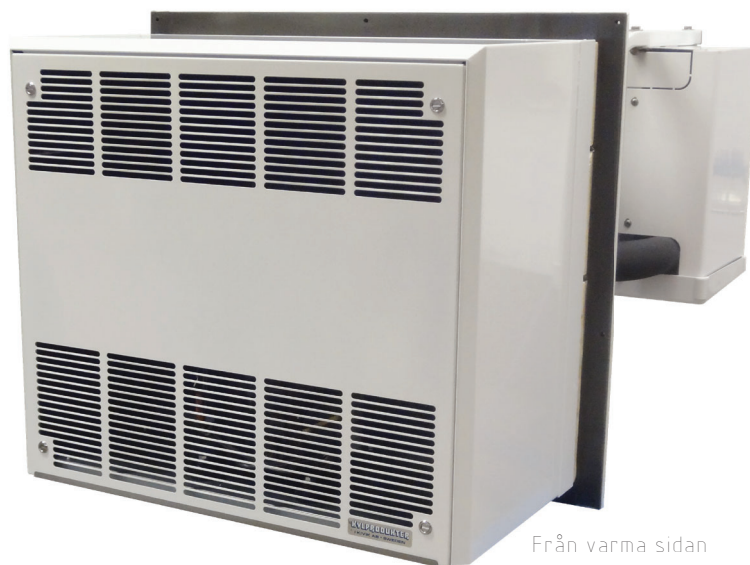
Från varma sidan